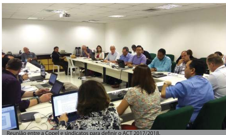
Reunião entre a Copel e sindicatos para definir o ACT 2017/2018.