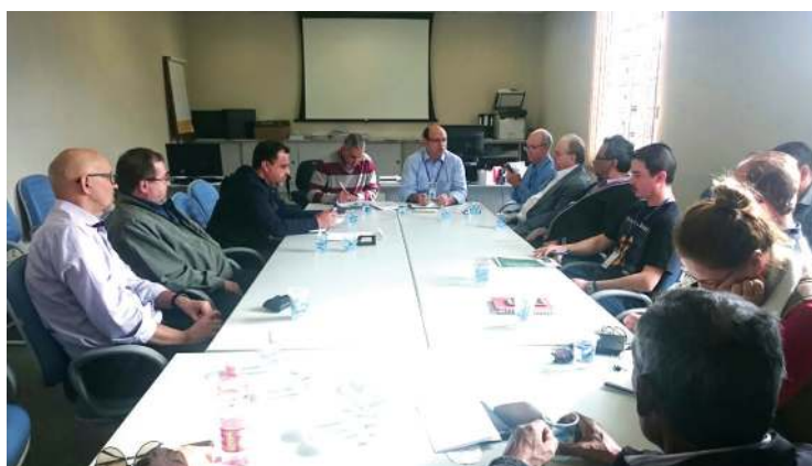
Reunião sobre a PPR 2016 da Sanepar.